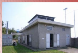
CT Via Europa

AGGIUDICATO A TESI s.r.l. L'AFFIDAMENTO DEL SERVIZIO PUBBLICO LOCALE DI TELERISCALDAMENTO E DELL'ESTENSIONE DELLA RETE IN BUSTO GAROLFO