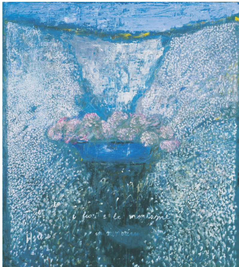
Ruggero Savinio I fiori e le montagne (2000)

Resterà aperta fino al 27 maggio alla Gnam la mostra «Arte programmata e cinetica. Da Munari a Biasi a Colombo e...», un viaggio alla scoperta di un movimento complesso e sofisticato. L'esposizione si occupa della storia dei gruppi e delle personalità più significative operanti tra gli anni 50 e gli anni 60.