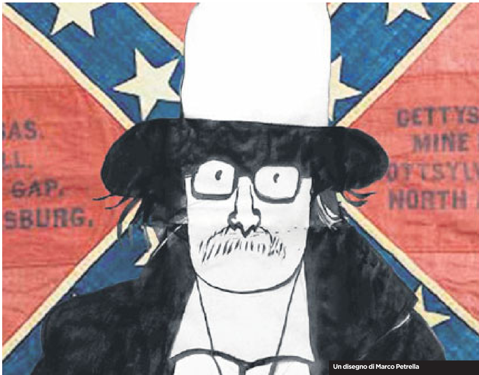
Un disegno di Marco Petrella