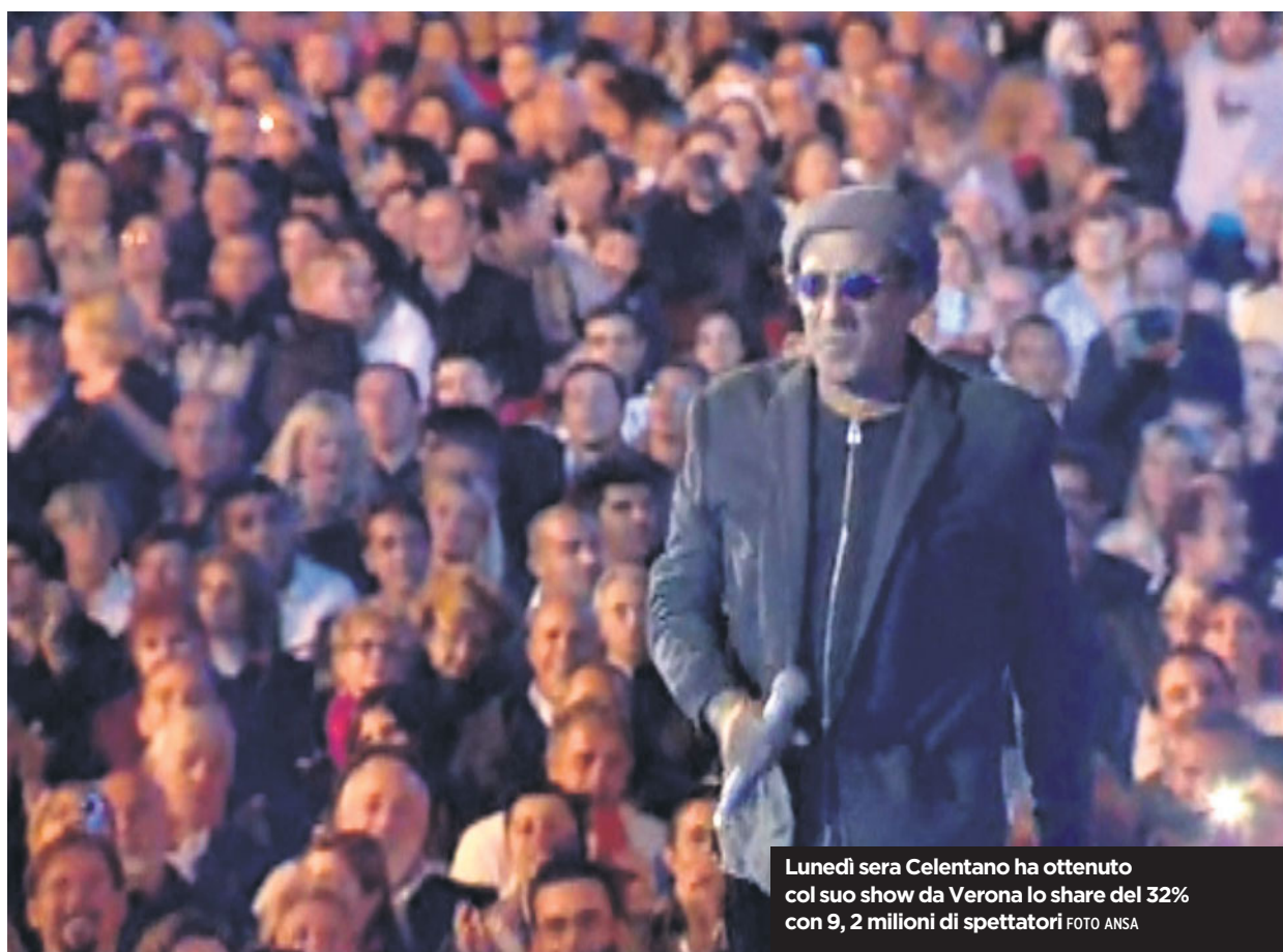
Lunedì sera Celentano ha ottenuto col suo show da Verona lo share del 32% con 9, 2 milioni di spettatori

«Ho assistito ad alcune delle letture della Commedia da parte di Roberto Benigni e credo che, molto più di altri, egli sappia incarnare il «dire» di Dante, entrare nel ritmo meditante, e pure «ansietato», dei canti, farsi cittadino di Firenze e dell'eterno. Dobbiamo molto alla sua fedeltà al poema se Dante è diventato, è tornato ad essere voce di popolo, speranza di una nazione e dell'umanità».