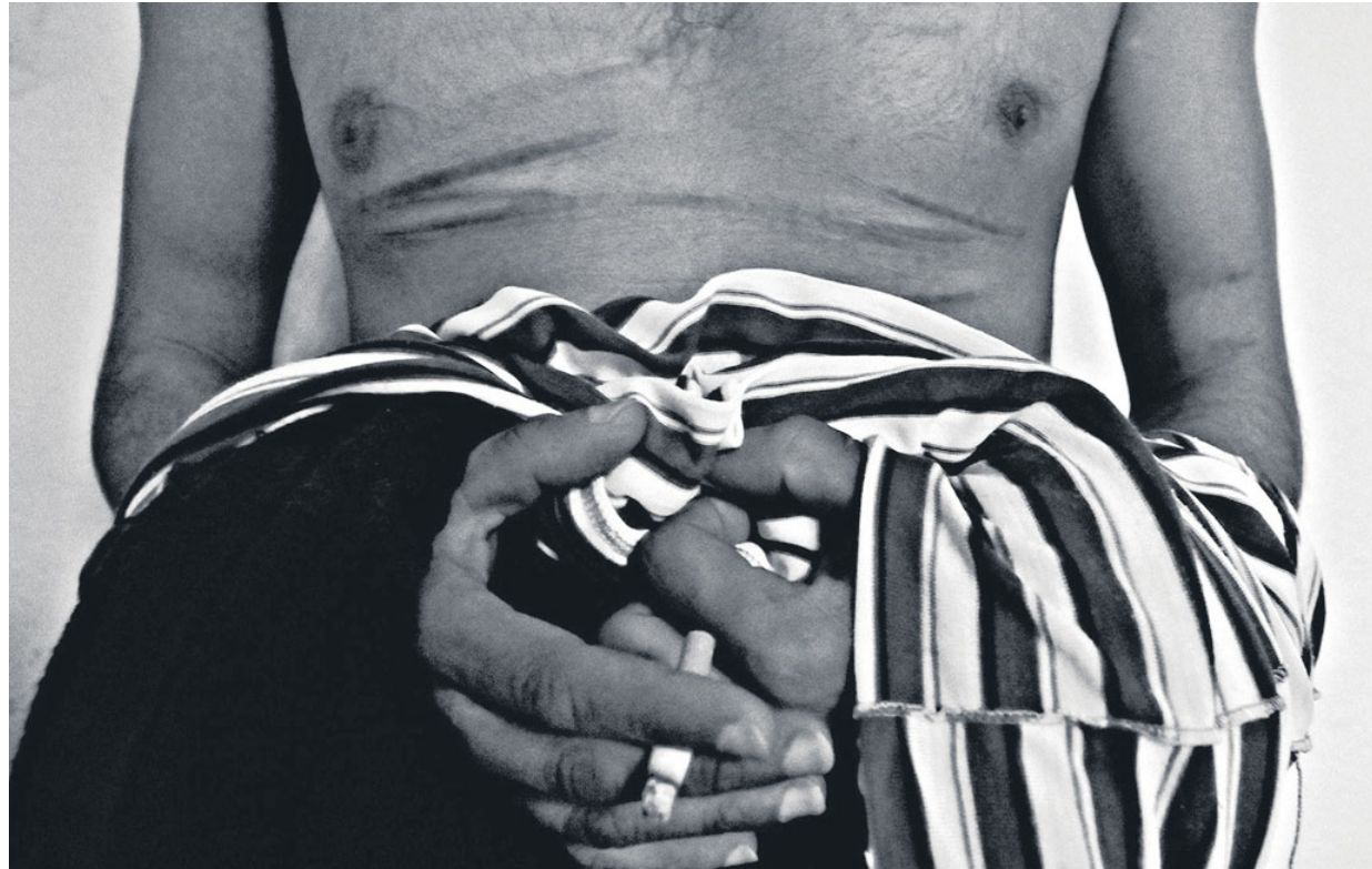
Gli ospedali psichiatrici giudiziari in Italia chiuderanno nel marzo del 2013