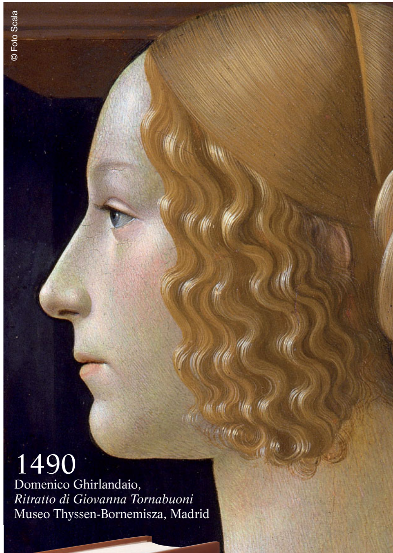
1490 Domenico Ghirlandaio, Ritratto di Giovanna Tornabuoni Museo Thyssen-Bornemisza, Madrid

Treccani celebra l'eccellenza del nostro Paese in una nuova prestigiosa opera.