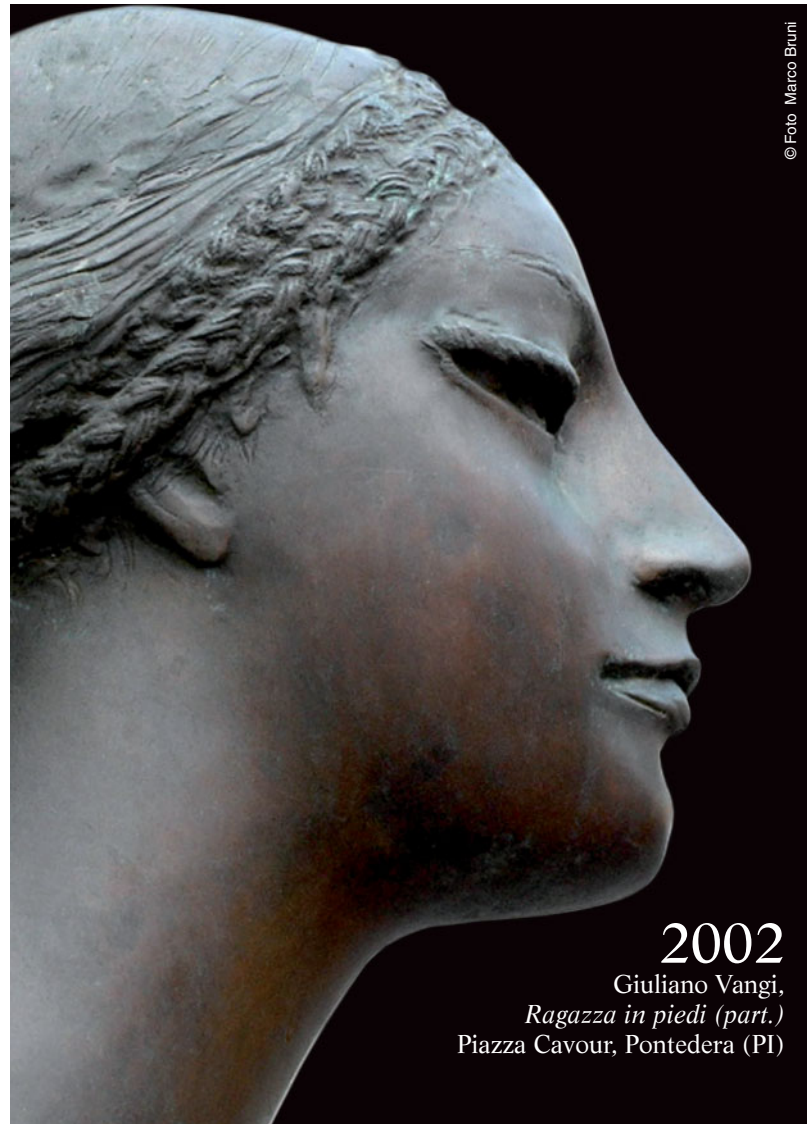
2002 Giuliano Vangi, Ragazza in piedi (part.) Piazza Cavour, Pontedera (PI)