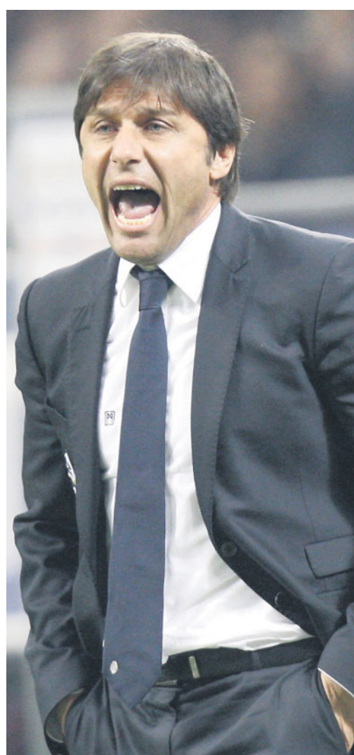
Antonio Conte, tecnico della Juve

... L'unica squadra contro cui il diavolo non rischia di finire all'inferno è lo Schalke 04. Le altre squadre fanno paura