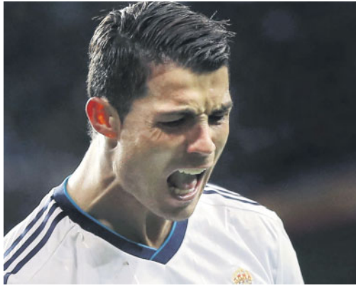
Cristiano Ronaldo del Real Madrid