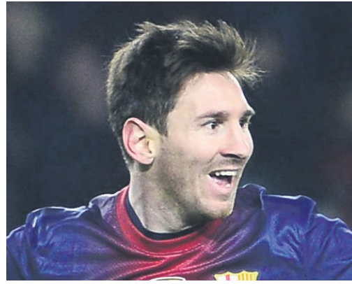
Messi del Barcellona