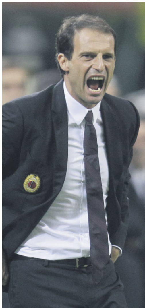
Massimiliano Allegri, allenatore del Milan

Con maggiore realismo, Stephan Lichsteiner