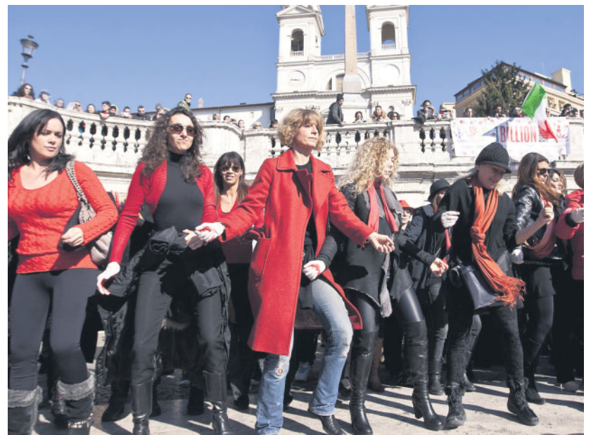
Flash mob contro la violenza sulle donne a Roma