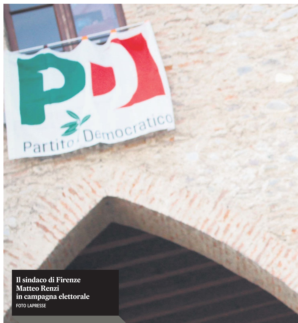
Il sindaco di Firenze Matteo Renzi in campagna elettorale

Il centrosinistra e il Pd hanno commesso «errori», ma la «paternità» va attribuita a «tutti», e «non solo a Bersani». Così Giacomo Portas, deputato Pd e leader dei Moderati, interviene nella discussione nata dopo il complicato quadro scaturito dall'esito delle elezioni politiche. «Da alcuni giorni a questa parte - riassume Portas - in troppi vogliono mettere Bersani sulla graticola per il risultato elettorale. È troppo facile fare i profeti, dopo. Errori ce ne sono stati, ma di certo la loro paternità è di tutti, compreso il sottoscritto, non di un uomo solo», dice il parlamentare, che poi ricordando le consultazioni con cui il centrosinistra ha indicato il suo candidato premier, aggiunge: «Dopo le primarie, Bersani, da tutti, è stato indicato come colui che poteva riportare il Pd al governo. In troppi ora si voltano dall'altra parte dimenticando quei momenti. Ora più che mai, invece, - conclude il leader dei Moderati - bisogna essere uniti, perché il Paese ha bisogno di risposte da un grande partito qual è il Partito democratico».