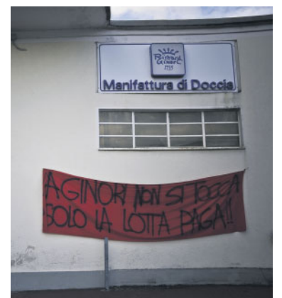
Protesta alla Ginori

Insomma, l'incremento è assicurato. A questo si aggiungerà presto l'aumento dell'Iva, che significa aumento di tutti i beni e dei servizi come quelli dell'energia o della telefonia. Gli esiti di questo secondo rincaro possono essere due: il rischio di un aumento dei prezzi, e quello di una nuova depressione della domanda. Difficile dire quale sia il più pericoloso per lo stato del Paese. I rincari colpiranno anche la casa, settore già stagnante da molto tempo. La nuova aliquota si applicherà anche a mobili, alla certificazione energetica, ai compensi per di geometri, architetti e ingegneri. E questo dato non è affatto secondario, perché la nuova aliquota arriverà con la fine della detrazione extra large del 50% sul recupero edilizio e con il 55% per il risparmio energetico, destinati proprio dal 1° luglio 2013 a tornare al 36 per cento. Ecco perché si dovrebbe evitare quell'aumento: ma chi ci sta pensando?