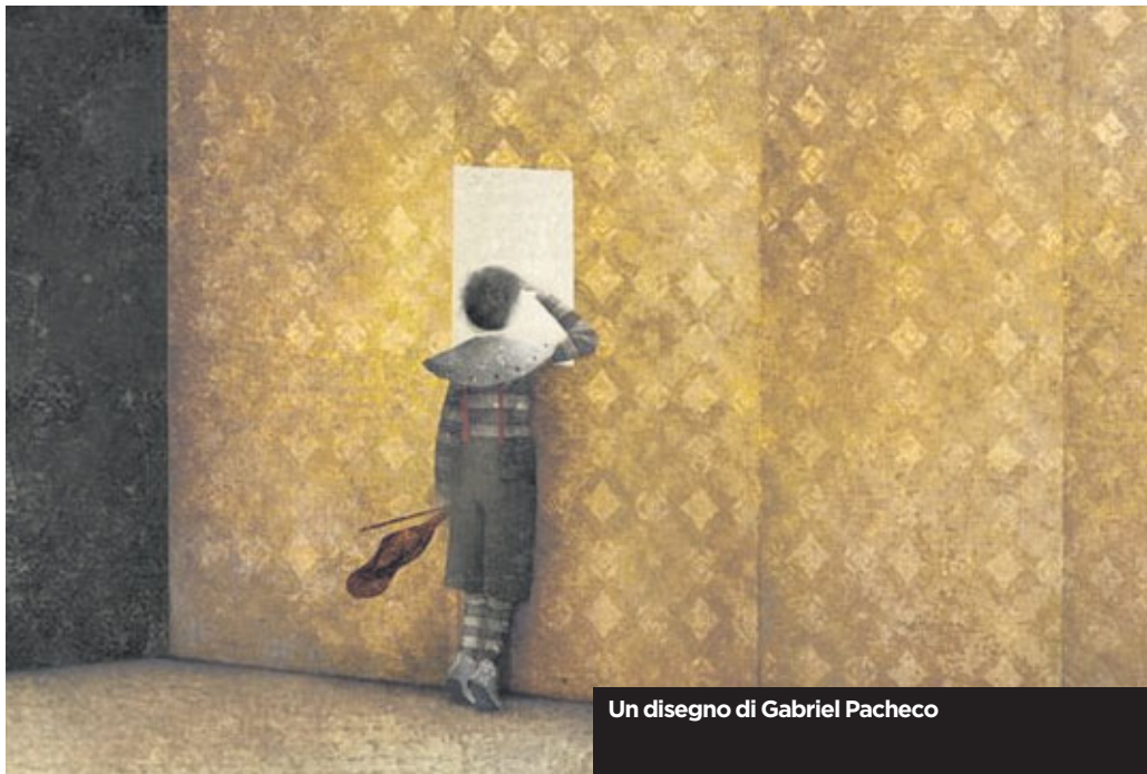
Un disegno di Gabriel Pacheco