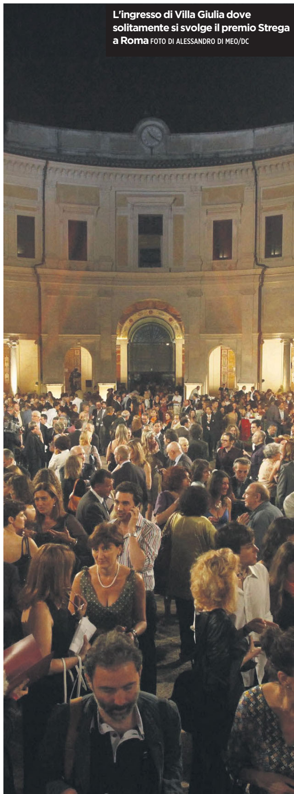
L'ingresso di Villa Giulia dove solitamente si svolge il premio Strega a Roma

Fino al 23 marzo, a Roma e in alcuni luoghi storici della Provincia, messi a disposizione dalla Provincia, si tiene «Da Donne a Donna», rassegna che vuole raccontare le tante figure femminili nel mondo dell'arte, politica, giornalismo, ambiente, letteratura, musica, cinema. Giunta alla sua terza edizione, la manifestazione è rivolta alle figure femminili europee che hanno contribuito, con la loro vita e le loro opere, a far crescere i propri Paesi, e che sono state capaci di produrre eccellenza nel campo della cultura, in tutte le sue espressioni. «DonnEuropa» il titolo di questa edizione, con la sua volontà di dare spazio a grandi personaggi femminili, questa volta europei: musiciste, poetesse, letterate, scienziate, scrittrici, attrici, giornaliste, politiche.