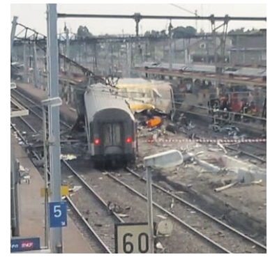
IL TRENO DERAGLIATO NELLA STAZIONE DI BREITIGNY-SUR-ORGE

Intanto oltre ai favorevoli organizzano veglie di protesta le organizzazioni cattoliche che esprimono anche la vicinanza della Chiesa alle donne che si trovano in difficoltà durante la gravidanza e ha ricordato come il nascituro non sia «un'estensione della madre, bensì un essere umano con delle potenzialità, che ci chiede silenziosamente ma profondamente, di essere amato».