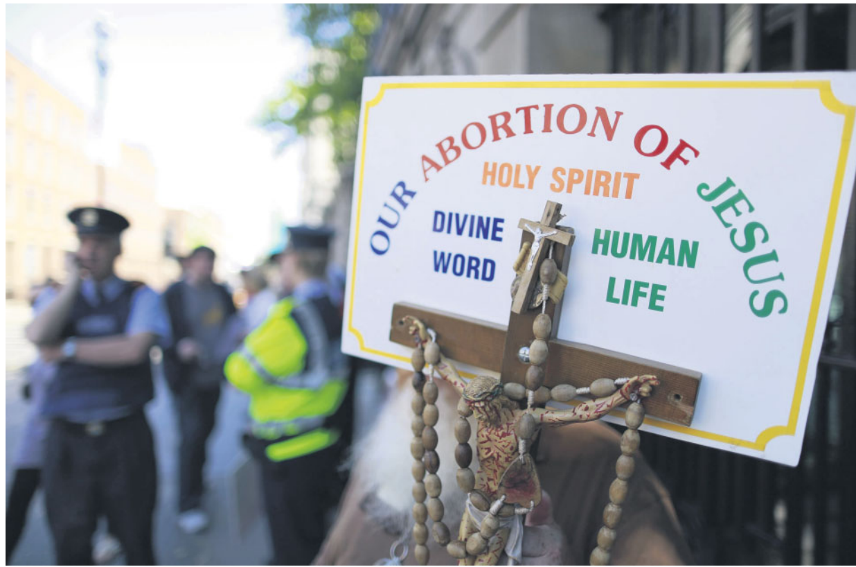
La protesta dei manifestanti cattolici «pro-life» contro l'aborto davanti al Parlamento irlandese

● La legge passa con 127 voti sì, 32 i contrari ● Il premier conservatore Kenny espelle 5 dissenzienti ● Polemica sulla clausola del suicidio