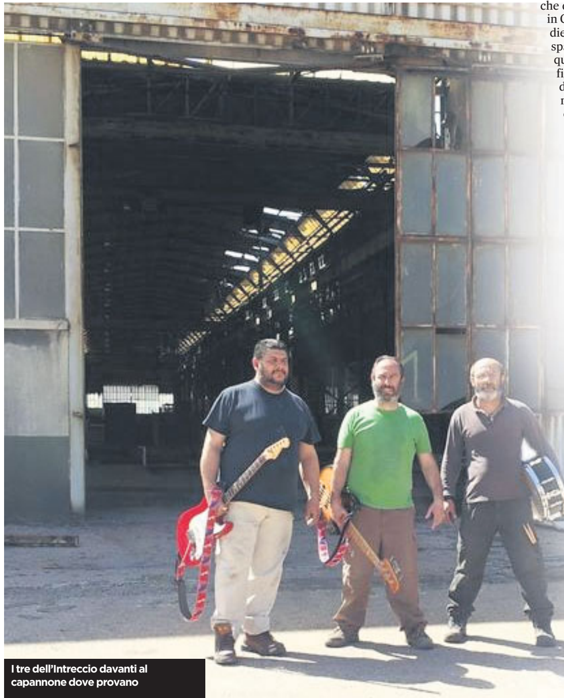
I tre dell'Intreccio davanti al capannone dove provano