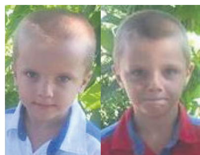
I due gemellini scomparsi