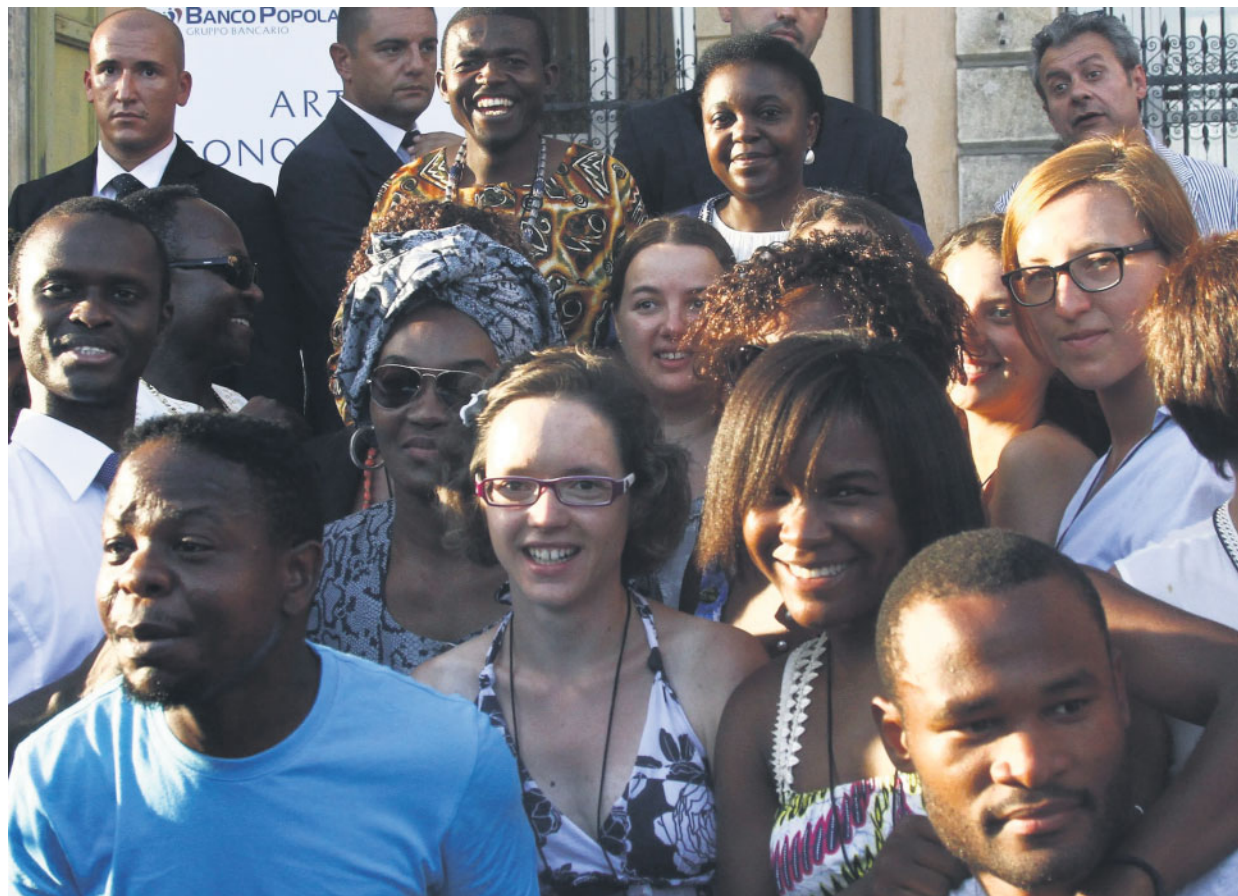
La ministra per l'Integrazione Cecile Kyenge a Verona per inaugurare l'African Summer School