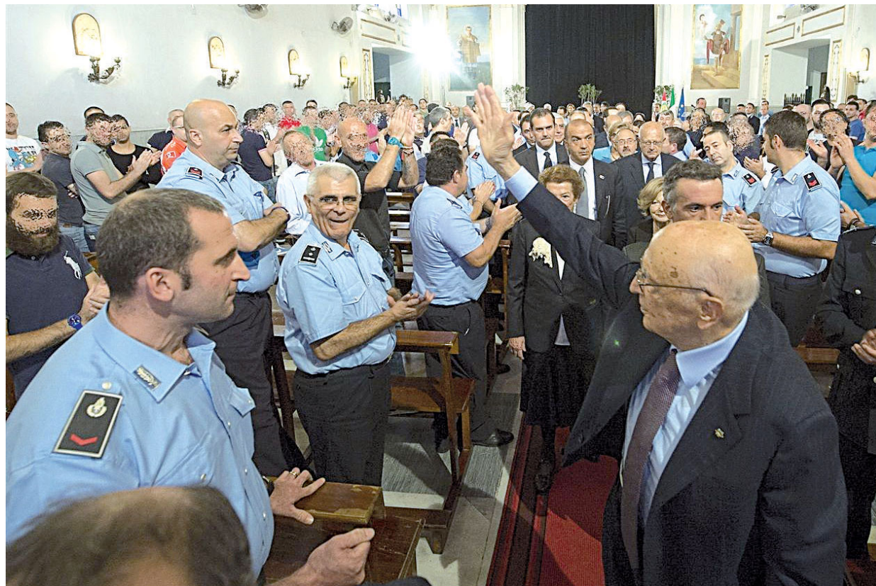
Il presidente Giorgio Napolitano nel corso della recente visita alla Casa circondariale di Poggioreale