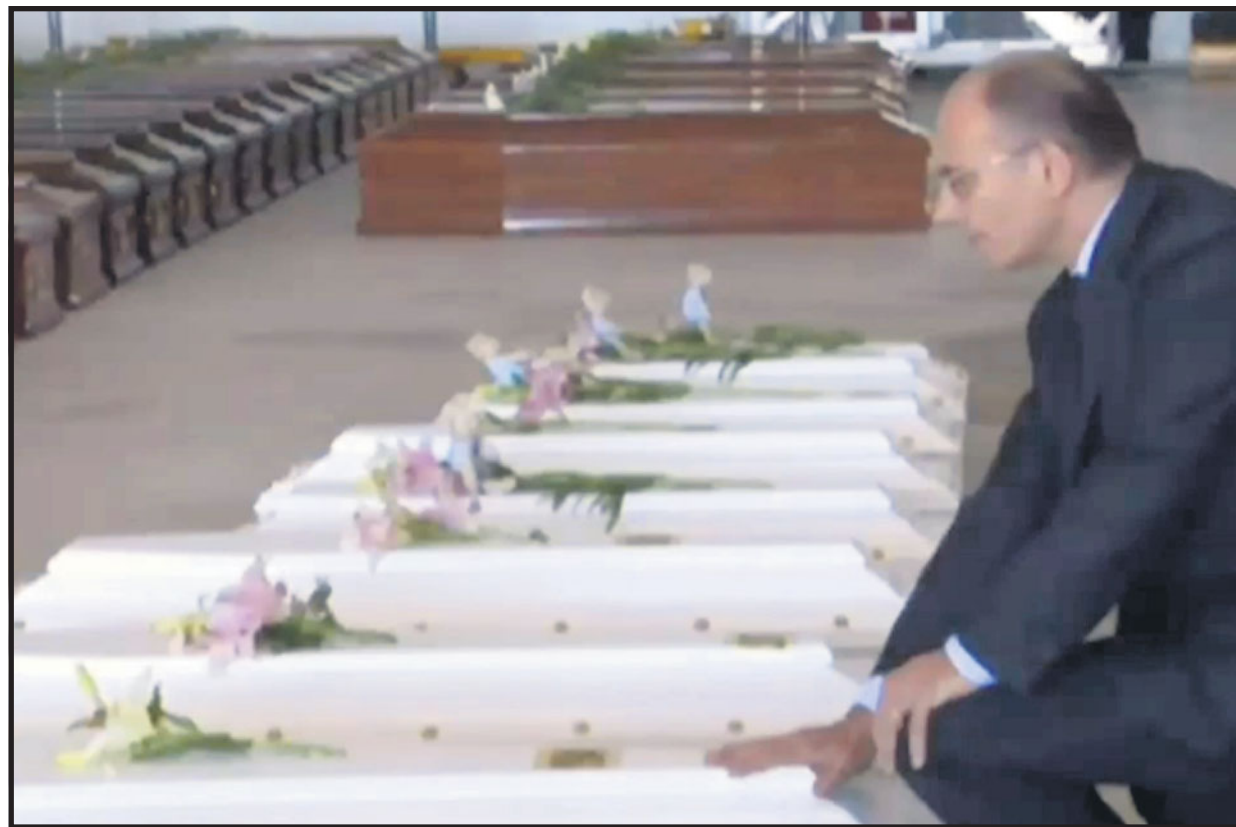
Il premier Enrico Letta s'inginocchia e depono fiori su una delle bare all'interno dell'hangar di Lampedusa.