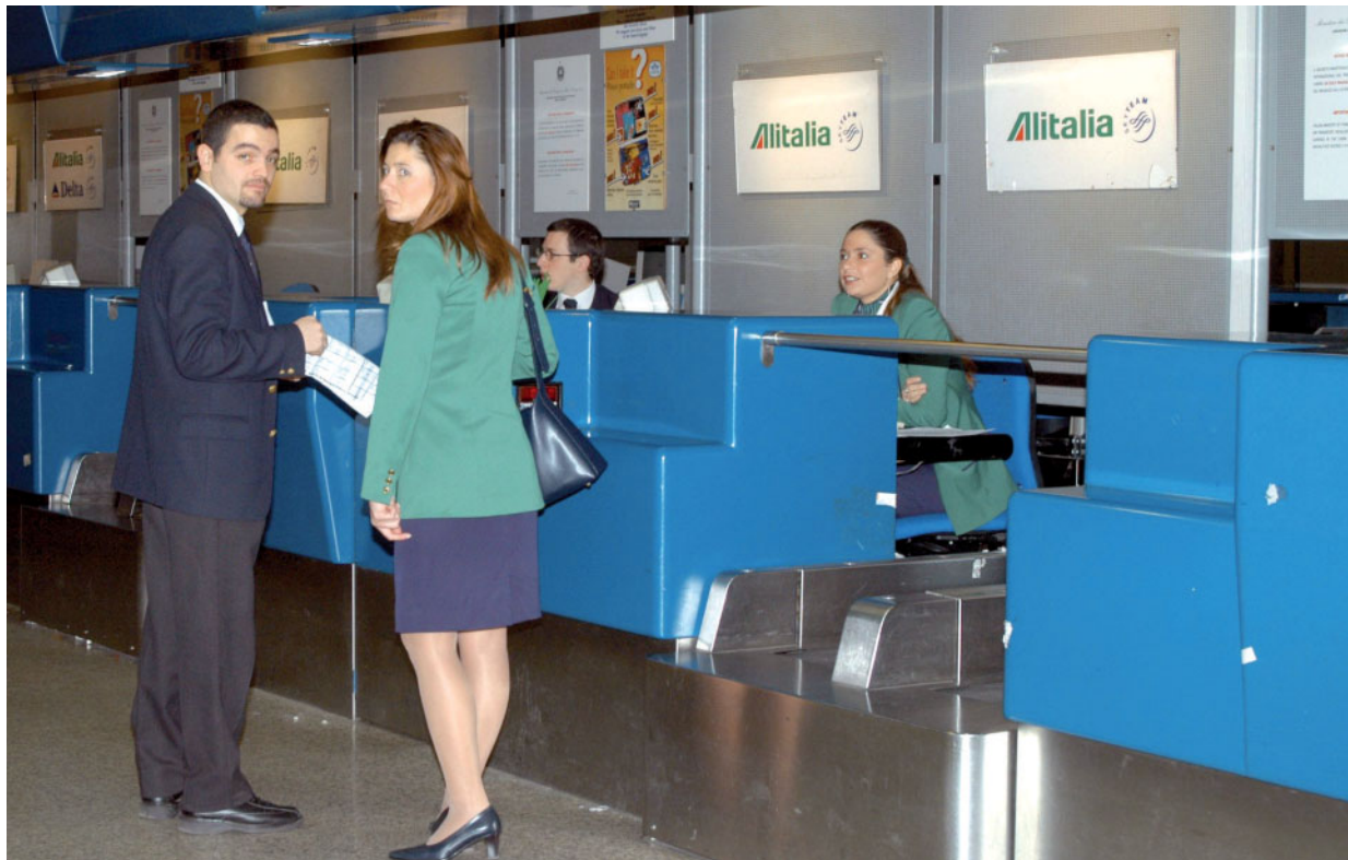
Aeroporto Leonardo da Vinci, hostess ai banchi Alitalia.

Il piano verrà presentato oggi al Cda del gruppo, e in realtà le indiscrezioni parlano di migliaia di esuberi (da 2 a 4mila), tra cui 250 piloti, 850 dipendenti tra personale di volo e di terra, e di tagli alle voci di spesa (verrebbero ridotte flotta e benefit, alcune rotte di medio e lungo raggio, tagliate le retribuzioni) per raggiungere l'obiettivo di 250-300 milioni di risparmi in tre anni. E venerdì si chiudono i termini per poter sottoscrivere l'aumento di capitale, con Air France-Klm probabile defezionaria (che quindi diluirebbe la propria quota dall'attuale 25% al 10% o anche meno). Poste Italiane si è impegnata per 75 milioni, ma il vero problema a questo punto riguarda le prospettive di alleanze internazionali, essenziali per la sopravvivenza della compagnia italiana. Nel caso Air France, non convinta del piano (conditio sine qua non per il gruppo franco-olandese sono consistenti tagli al personale e alle rotte), dovesse effettivamente defilarsi, sembra prendere quota l'ipotesi di intervento da parte della russa Aeroflot, che già in passato aveva manifestato interesse per Alitalia. Anche se Lupi continua a non dare per persa la partita: