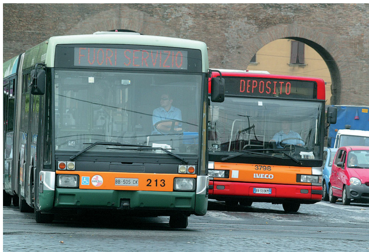
Autobus diretti al deposito

... 94.7 milioni gli introiti Atac dai biglietti integrati nel 2001 ... 110 milioni gli introiti dei Bit nel 2008 (sindaco Veltroni) ... 94.1 milioni di introiti dai Bit nel 2013 (sindaco Alemanno)