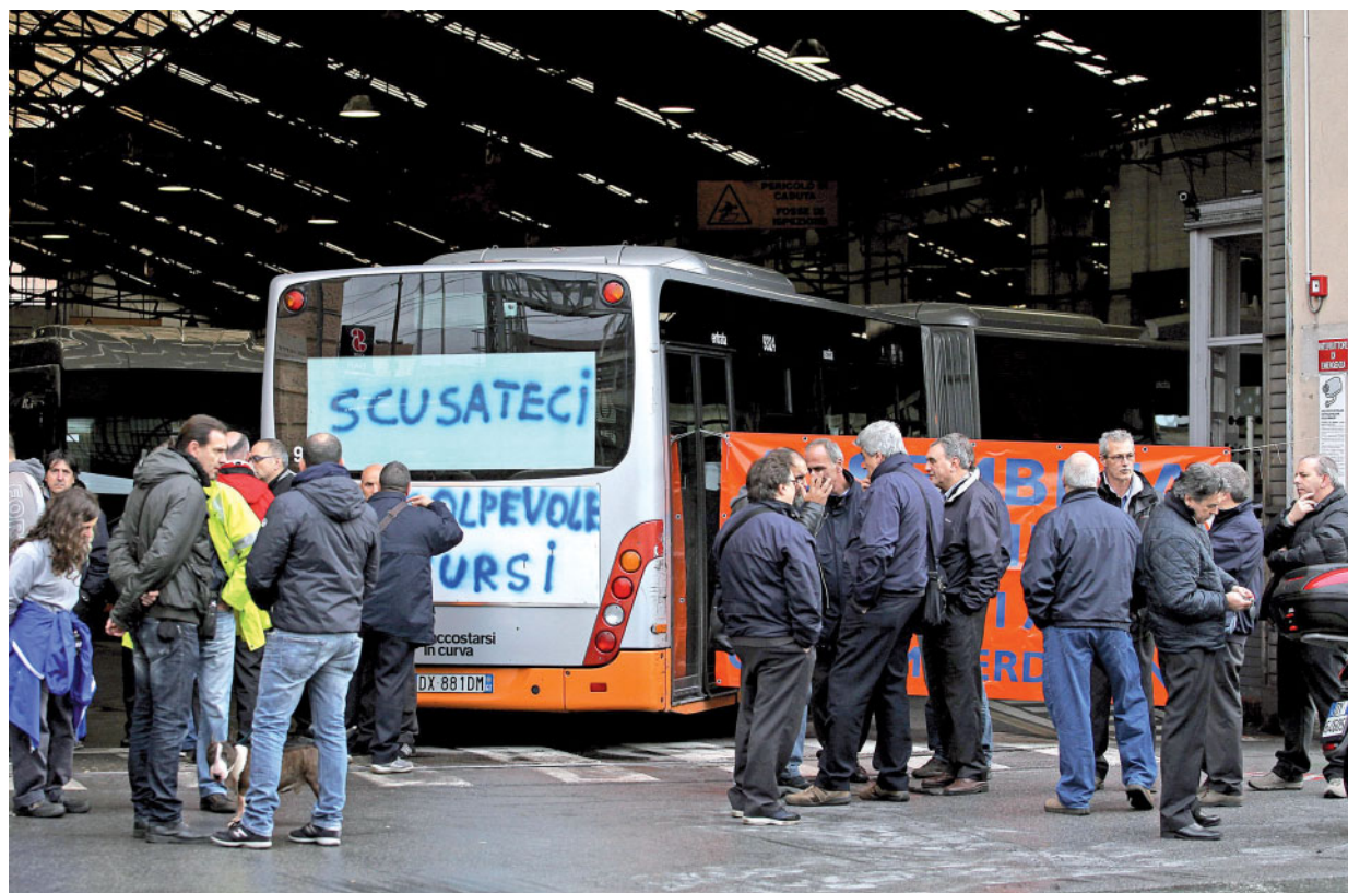
La rimessa Amt di Sampierdarena