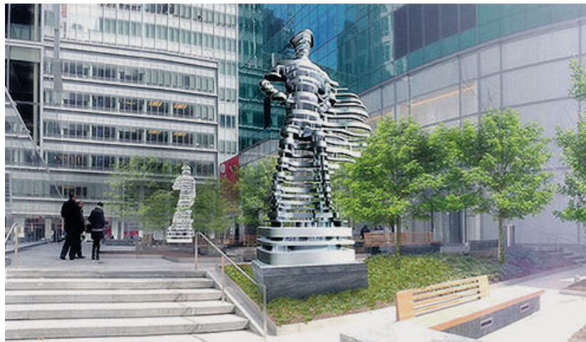
Il disegno che illustra i «Guardians» di Saracino per Eni