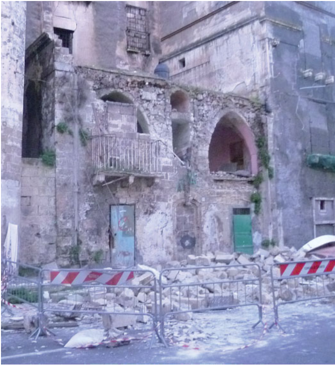
Uno dei palazzi crollati negli ultimi anni