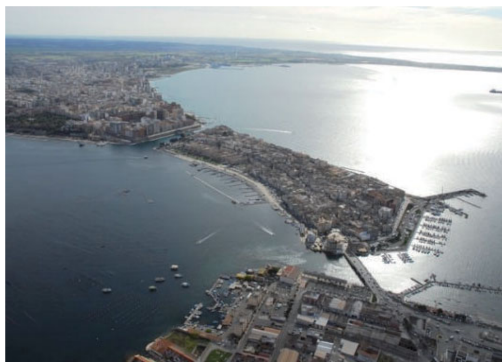
Una veduta aerea della città vecchia fra il Mar grande e il Mar piccolo

so» dice in dialetto un ragazzino. Quello di via di Mezzo è il terzo crollo in pochi mesi. Due anni fa ci stava per scappare il morto. Venne giù l'antica chiesetta di San Paolo e travolse un uomo all'interno della sua auto. Nel 1975 il cedimento di un solaio in vico Reale, uccise sei persone, tre erano bambini. Fu la spinta decisiva verso lo spopolamento.