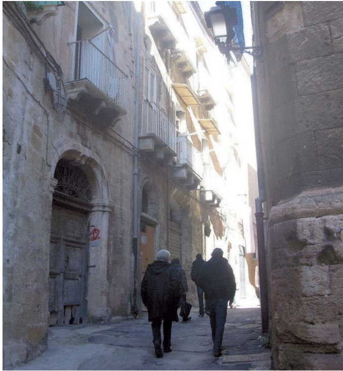
I vicoli deserti della Taranto antica