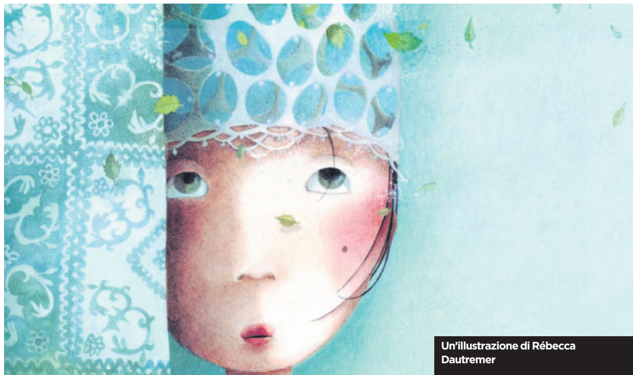
Un'illustrazione di Rébecca Dautremer

La letteratura di una nazione è davvero nel senso più letterale del termine un landscape, la «visione di una terra». Walt Whitman interrogava così i poeti d'America: L'opera vostra sa resistere al paragone dei campi aperti, sulla riva del mare? Ecco dunque la frontiera. In origine spazio dove è possibile rinascere immergendosi in uno stato di innocenza, poi luogo irto di pericoli, confine tra civiltà e barbarie, fino a metafora di un mondo alternativo, fluido e in perpetuo divenire.