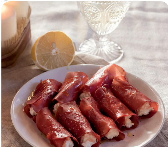
Involtini di bresaola