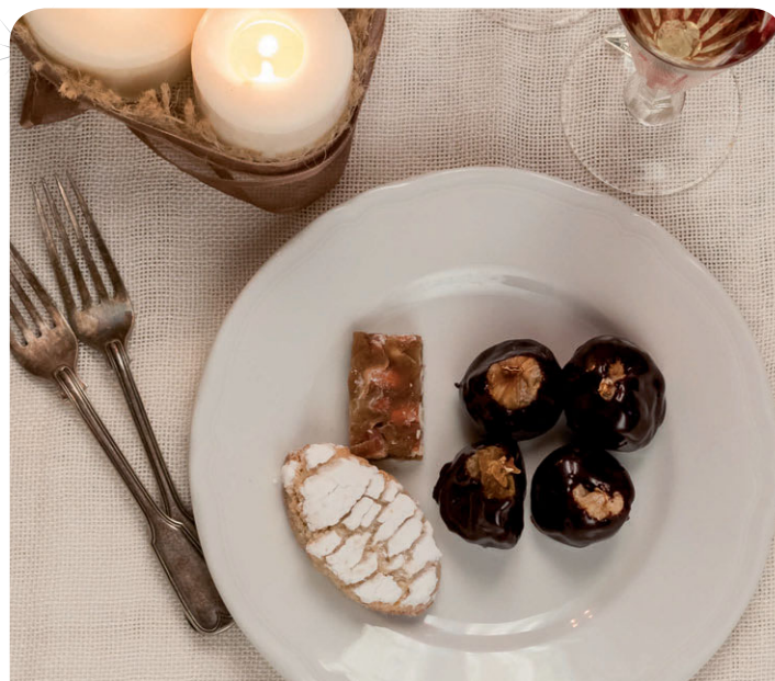
Fantasia di Siena Sapori e fichi secchi ricoperti di cioccolato