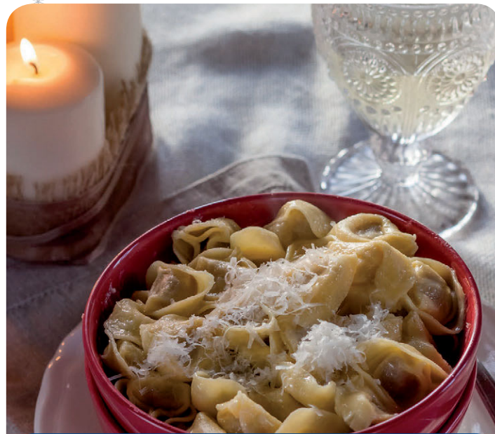
Tortellini con burro e parmigiano