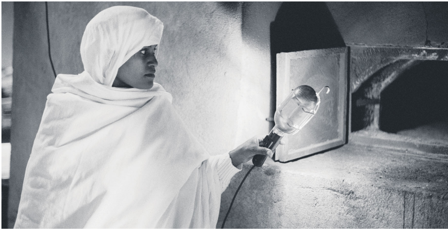
Nella pagina tre delle 300 fotografie di Sebastiana Papa raccolte nel libro «La Repubblica delle donne»