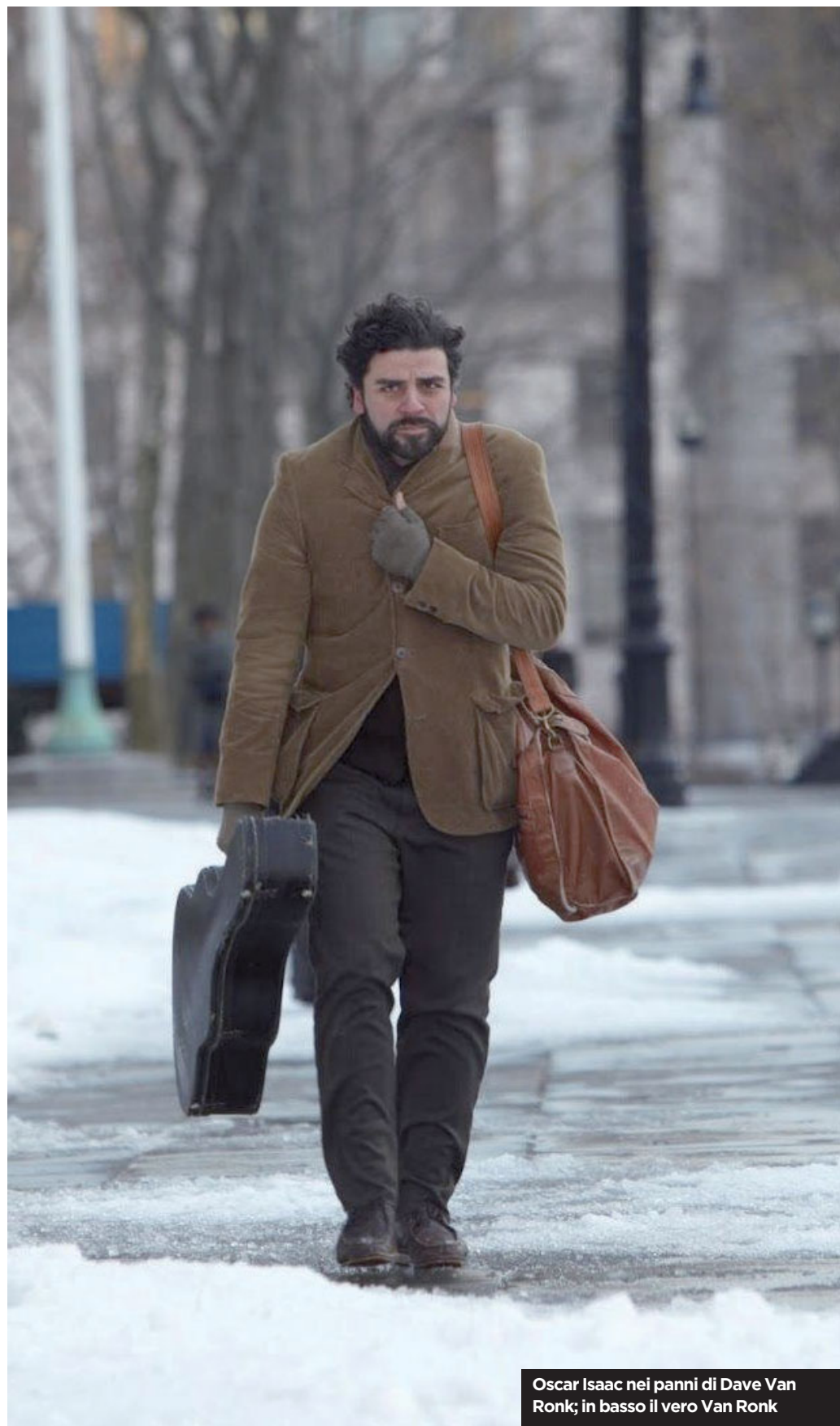
Oscar Isaac nei panni di Dave Van Ronk; in basso il vero Van Ronk