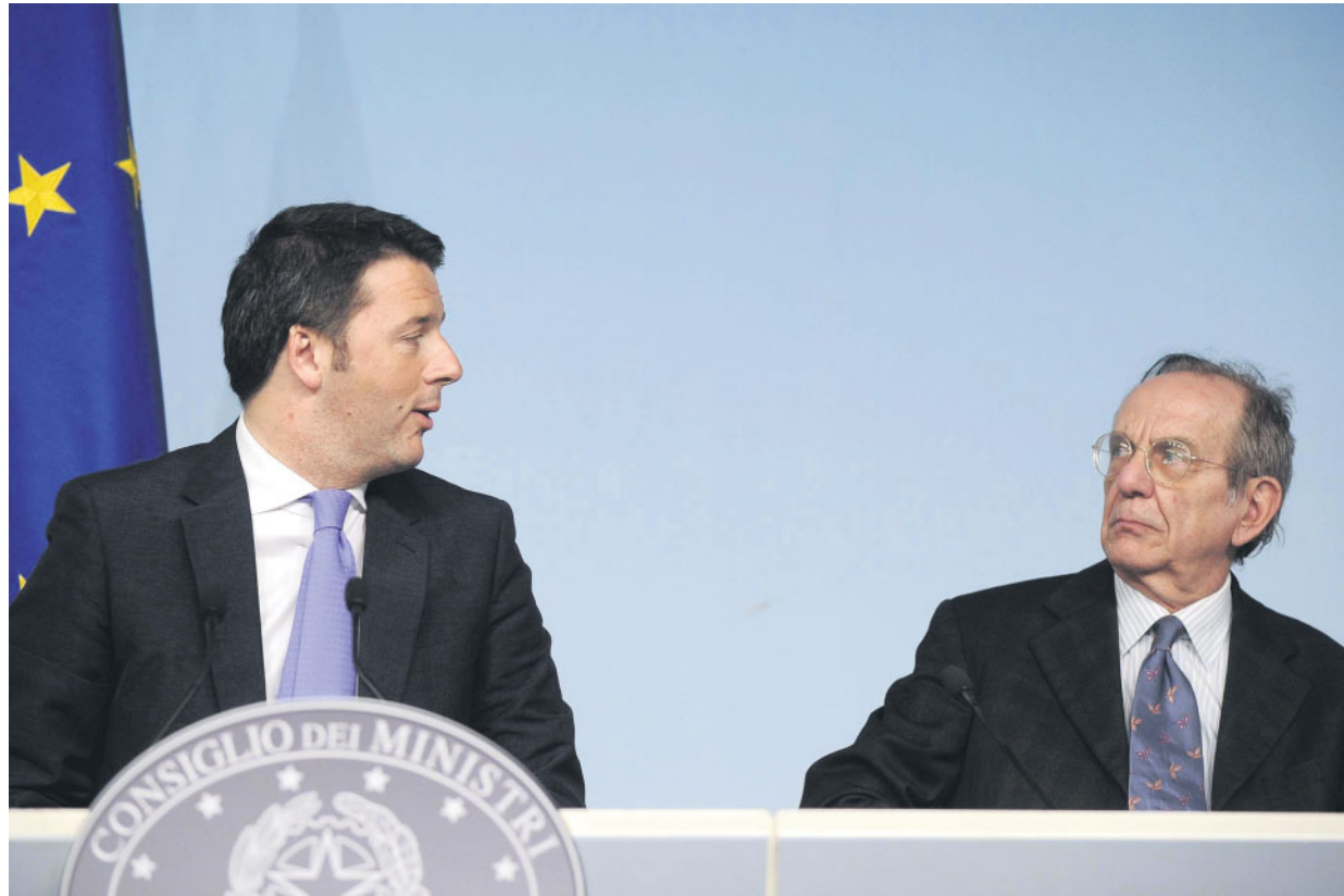
Il premier Matteo Renzi e il ministro dell'Economia Pier Carlo Padoa-Schioppa durante la conferenza stampa.