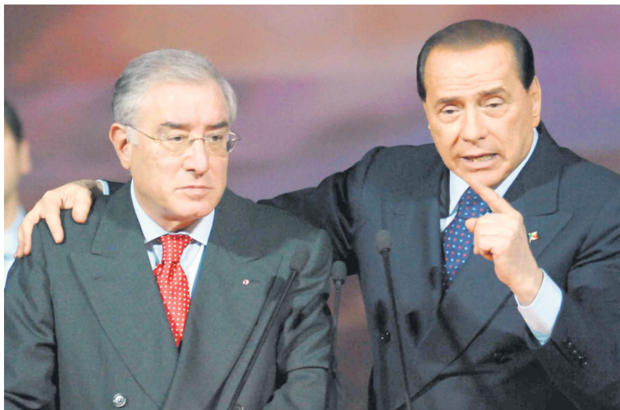
Marcello Dell'Utri con Silvio Berlusconi a un congresso dei «Circoli del buon governo»