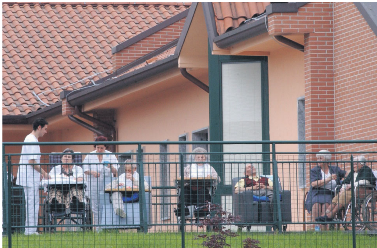
L'Istituto Sacra Famiglia di Cesano Boscone dove l'ex Cav dovrà andare una volta a settimana