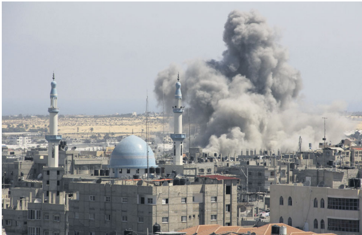
Il fumo si alza dalle macerie dopo i raid israeliani su Gaza.