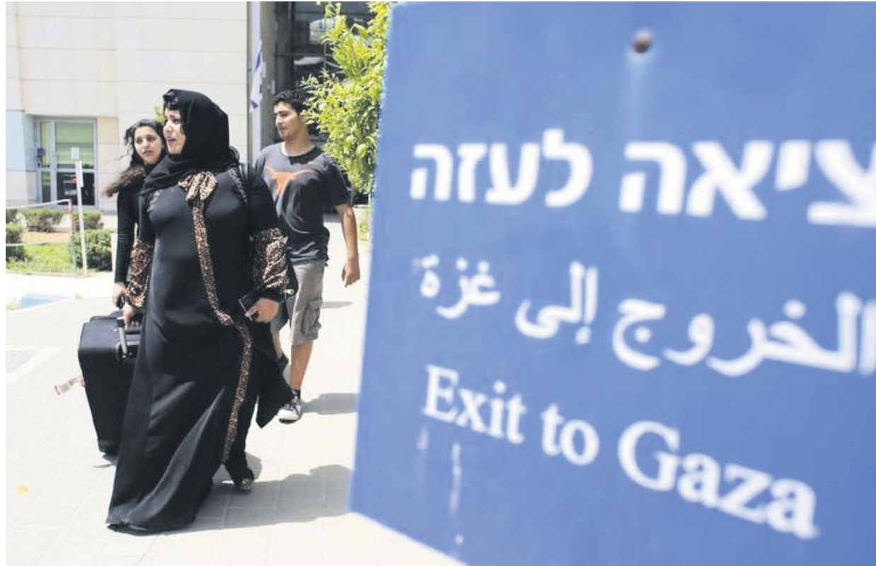
Famiglie palestinesi in fuga da Gaza.