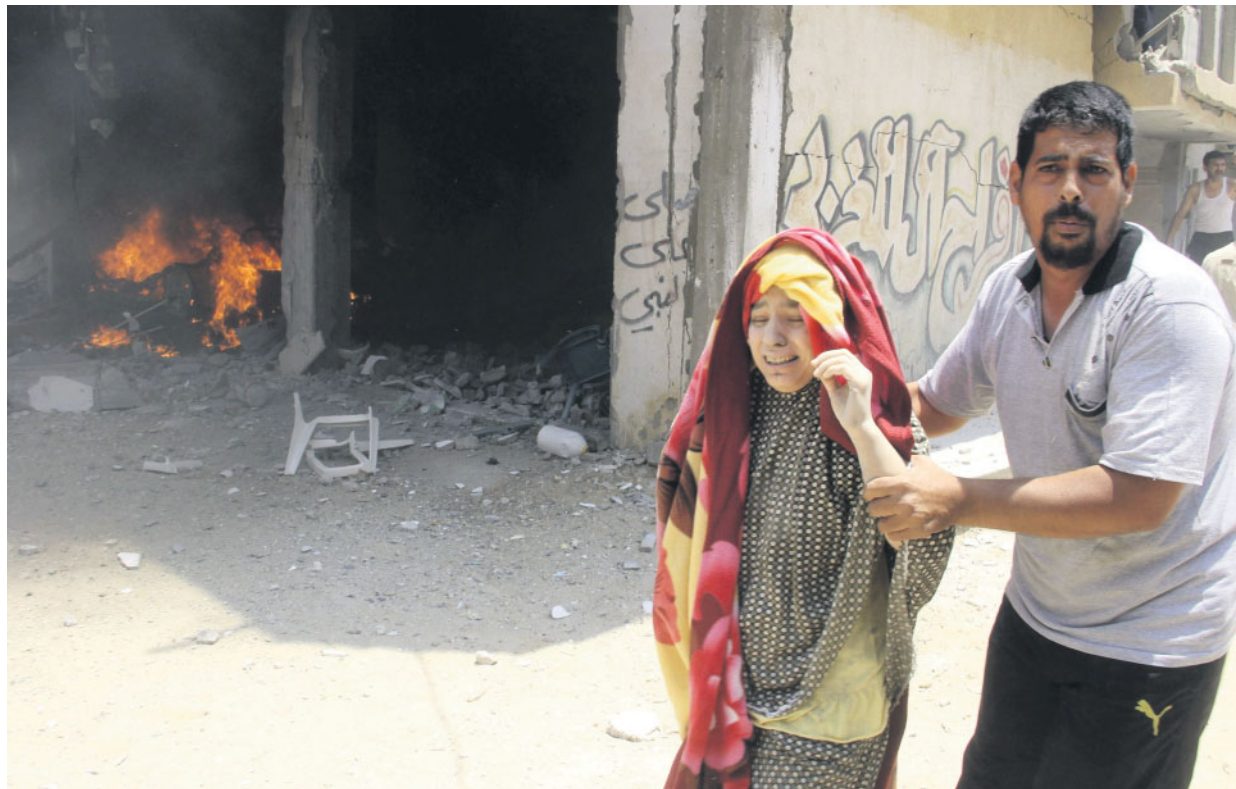
Un palestinese aiuta una donna rimasta ferita negli attacchi